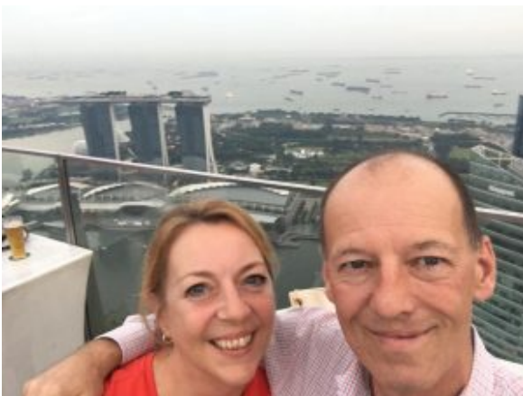
Blick vom 1-Altitude

Es gibt so viele Rooftop-Bars in Singapur, aber nur eine kann die höchste sein: Das 1-Altitude, auf 282 Meter im 62. Stock am Raffles Place gelegen, bietet einen einzigartigen 360°-Blick.